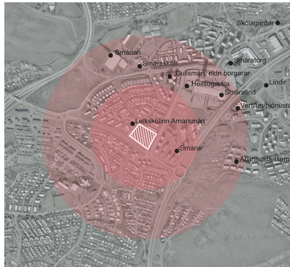
Þjónusta í göngufæri

Út frá miðju hverfisins eru dregnir tveir hringir með 400m radíus og 800m radíus. Ætla má að fullorðin manneskja gangi 800 metra á 12 mínútum ef miðað er við meðalgönguhraða um 5 km/klst.